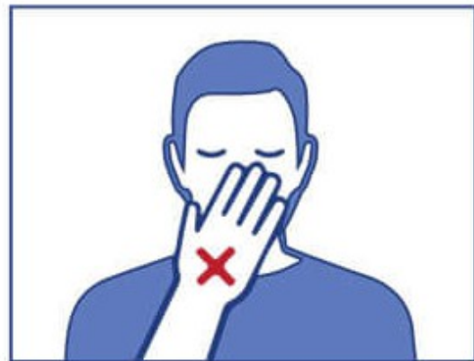
NE PAS SE TOUCHER LE VISAGE