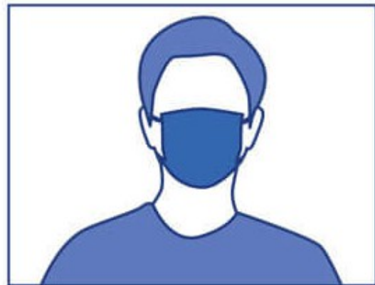
Port du masque OBLIGATOIRE